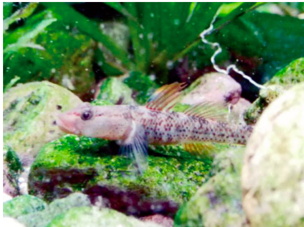
图为笔者在台州西部采到的雀斑吻鰕虎公鱼，第一背鳍拉丝虽然没到极致但已非常震撼

顾名思义，这种广泛分布于浙江各地的小型鰕虎的颊上长满“雀斑”——黑色斑点。它的体色总体偏白而背鳍拉长，第一背鳍上的黄蓝色金属斑更是梦幻。成年雄性的嘴相当大，几乎可以口吞黑壳虾，在繁殖季节，雄性会由白色变为炭一样黑，但两颊处会有白色横带，黑白对比也有可看性。它们是一种很温柔的小型鰕虎，与异种之间几乎不会争斗，同种之间也不会争得死去活来，所以饲养一小群也不失是个好选择。