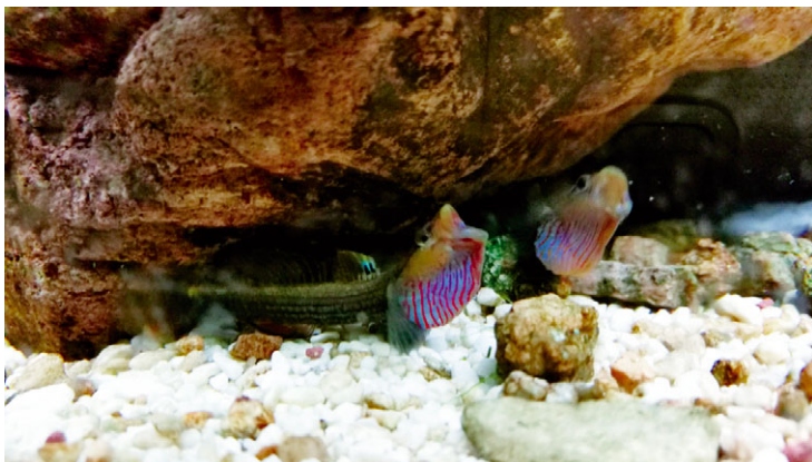
图为乌岩岭吻鰕虎在互相夸示

在浙江，夏季风带来了丰富的降水，西部与东南都为山区，流淌着一条条溪流。鰕虎就都生活在这些溪流里。在缓急流交界处，是鰕虎喜爱呆的地方。翻石头就容易找到它们的踪迹。饲养久了，就会发现鰕虎的习性相当有趣。