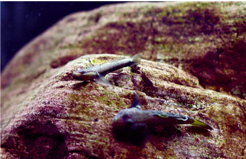
图为台州南部的乌岩岭吻鰕虎，属于北部类群