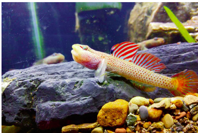
仅仅杭州的神农吻鰕虎，就有那么多令人眼花缭乱的表现