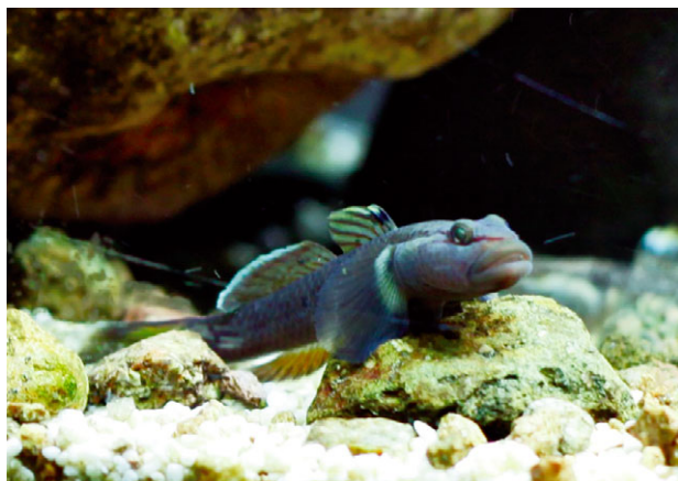
这是笔者在浙东南采集到的神农吻鰕虎，与浙西的又不同